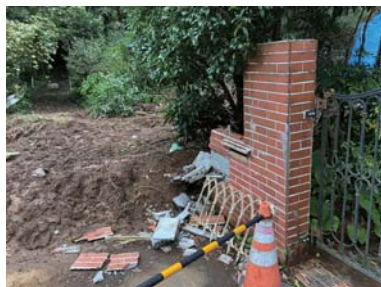
土砂崩れで門やエアコンが被害