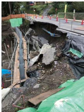
通行止めの吉野街道