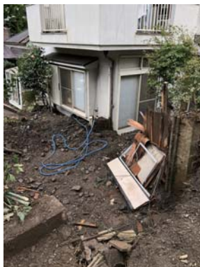
泥で埋もれ床上浸水

Aさんによると、この水路は3年前にも同様に埋まり、簡易的な措置がされていたとのこと。「今回も急いで対応しなければ、また次の大雨でさらに被害がでる可能性があります。ありますが、市も対応しきれていないので、親せきの方にお願ひして、小さな土木機械で応急処置の水路を掘りました」ということでした。