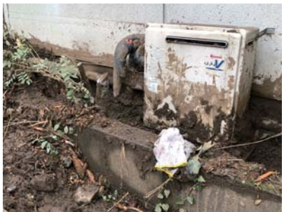
泥水で給湯機が故障